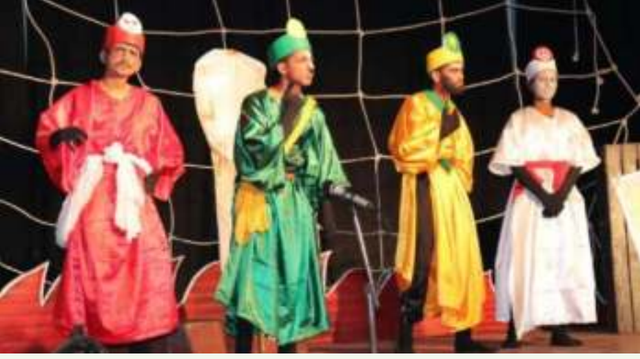
ಕತ್ತರಿ ಕಾರ್ಪೊರೇಷನ್ ನಾಟಕದ ದೃಶ್ಯ