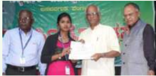
ದ್ವಿತೀಯ ಬಹುಮಾನ ಮಂಜುಳ - ಪ್ರಥಮ ಪಿ.ಯು.ಸಿ. 'ಡಿ'