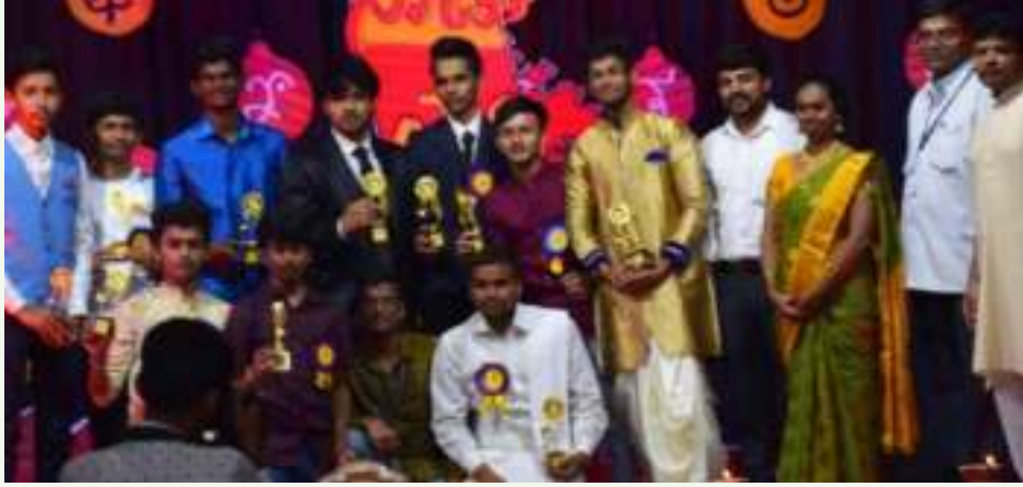
▲ ಅತ್ಯುತ್ತಮ ನಾಟಕ ತೃತೀಯ ಬಹುಮಾನ ಶ್ರೀಕೃಷ್ಣ ಸಂಧಾನ ದ್ವಿತೀಯ ಪಿ.ಯು. 'ಎಫ್'