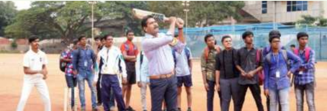
74ನೇ ಕ್ರೀಡಾಕೂಟದಲ್ಲಿ ಮುಖ್ಯ ಅತಿಥಿ ಶ್ರೀ ಬಸವರಾಜ್ ಸೋಮಣ್ಣನವರ್ ರವರ ಬ್ಯಾಟಿಂಗ್ ವೈಖರಿ