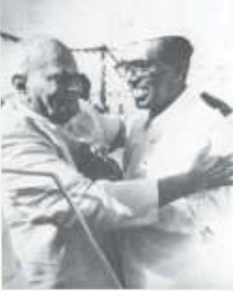
ಅಂದಿನ ರಾಷ್ಟ್ರಪತಿಗಳಾದ ಶ್ರೀ ವಿ. ವಿ. ಗಿರಿಯವರೊಂದಿಗೆ