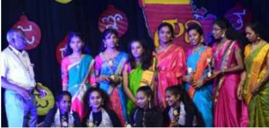
▲ ತೀರ್ಪುಗಾರರ ಮೆಚ್ಚುಗೆ ಪಡೆದ ನಾಟಕ, ಹಳೆ ಬೇರು ಹೊಸ ಚಿಗುರು ಪ್ರಥಮ ಪಿ.ಯು. 'ಬಿ'