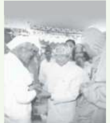
ಅಂದಿನ ರಾಷ್ಟ್ರಪತಿ ಡಾ. ಎ. ಪಿ. ಜಿ. ಅಬ್ದುಲ್ ಕಲಾಂ ರವರೊಂದಿಗೆ