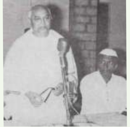
ಅಂದಿನ ಮುಖ್ಯಮಂತ್ರಿ ಶ್ರೀ ಎಸ್. ನಿಜಲಿಂಗಪ್ಪನವರೊಂದಿಗೆ