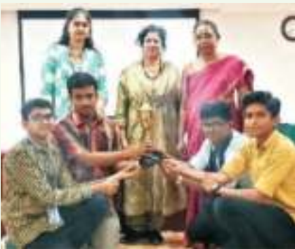
ಅಂತರ ಕಾಲೇಜು ವಿಜ್ಞಾನ ಭಾಷಣ ಸ್ಪರ್ಧೆಯಲ್ಲಿ ಬಹುಮಾನ ಪಡೆದ ನಮ್ಮ ವಿದ್ಯಾರ್ಥಿಗಳು.

2019-20ನೇ ಸಾಲಿನಲ್ಲಿ ವಿಜ್ಞಾನ ವಿಷಯಗಳ ಬಗ್ಗೆ ನಡೆಸಿದ ಅಂತರಕಾಲೇಜು ಭಾಷಣ ಸ್ಪರ್ಧೆಯಲ್ಲಿ ನಮ್ಮ ಕಾಲೇಜಿನ ವಿದ್ಯಾರ್ಥಿಗಳು ಈ ಬಾರಿಯೂ ಪರ್ಯಾಯ ಪಾರಿತೋಷಕವನ್ನು ತಮ್ಮದಾಗಿಸಿಕೊಂಡು ಕಾಲೇಜಿಗೆ ಕೀರ್ತಿ ತಂದಿದ್ದಾರೆ ಈ ಎಲ್ಲಾ ವಿದ್ಯಾರ್ಥಿಗಳಿಗೂ ಅಭಿನಂದನೆಗಳು.