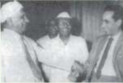
ನ್ಯಾಷನಲ್ ಕಾಲೇಜಿಗೆ ಸರ್ ಸಿ. ವಿ. ರಾಮನ್ ಭೇಟಿಯತ್ತಾಗ