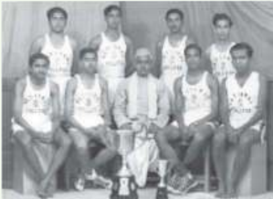
ನ್ಯಾಷನಲ್ ಕಾಲೇಜಿನ ಬ್ಯಾಸ್ಕೆಟ್‌ಬಾಲ್ ತಂಡದೊಂದಿಗೆ