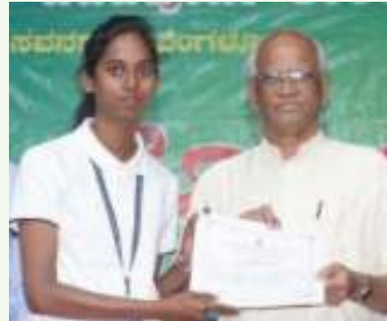
ವಲರ್‌ಮತಿ ದ್ವಿತೀಯ ಪಿಯುಸಿ 'ಡಿ'