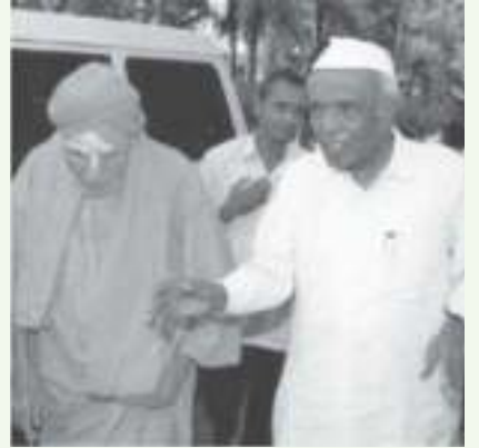
ಪರಮಪೂಜ್ಯ ಶ್ರೀ ಶಿವಕುಮಾರ ಸ್ವಾಮಿಜಿಯವರೊಂದಿಗೆ