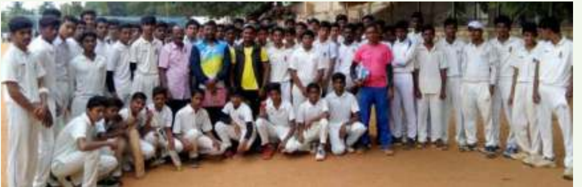
ಕಾಲೇಜಿನ ಕ್ರಿಕೆಟ್ ತಂಡ

ಓಟದಲ್ಲಿ ಚಿನ್ನದ ಪದಕವನ್ನು, 5 ಕಿ. ಮೀ. ಓಟದಲ್ಲಿ ಬೆಳ್ಳಿ ಪದಕವನ್ನು ಗೆದ್ದಿದ್ದಾರೆ. ಹಾಗೆಯೇ ಲಾನ್ ಟೆನ್ನಿಸ್ ಸ್ಪರ್ಧೆಯಲ್ಲಿ ರನ್ನರ್ ಅಪ್, ಲಾನ್ ಟೆನ್ನಿಸ್ ಡಬಲ್ಸ್‌ನಲ್ಲಿ ಪ್ರಥಮ ಸ್ಥಾನ ಪಡೆದು ಗುಜರಾತಿನಲ್ಲಿ ನಡೆಯಲಿರುವ ರಾಷ್ಟ್ರಮಟ್ಟದ ಸ್ಪರ್ಧೆಗೆ ಆಯ್ಕೆ ಯಾಗಿದ್ದಾರೆ. ಇವರಿಗೆ ಅಭಿನಂದನೆಗಳು.