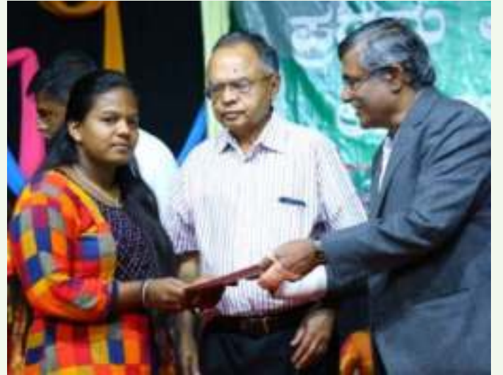
ಮೇಘ ಎನ್. - ವಾಣಿಜ್ಯ ವಿಭಾಗ