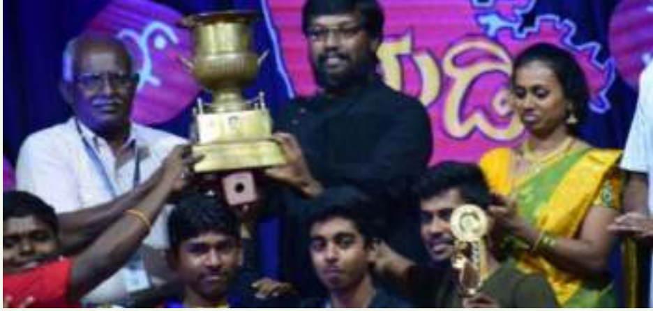
▲ ಅತ್ಯುತ್ತಮ ನಾಟಕ ದ್ವಿತೀಯ ಬಹುಮಾನ ದೈವ ಭೂತಾರಾಧನೆ ದ್ವಿತೀಯ ಪಿ.ಯು. 'ಸಿ'