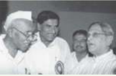
ಅಂದಿನ ಮುಖ್ಯಮಂತ್ರಿಗಳಾದ ಶ್ರೀ ಎಸ್. ಎಂ. ಕೃಷ್ಣ ರೊಂದಿಗೆ