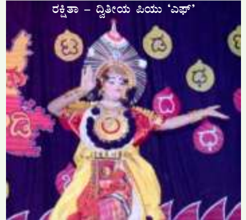
ರಕ್ಷಿತಾ - ದ್ವಿತೀಯ ಪಿಯು 'ಎಫ್'

ಕನ್ನಡ ವರ್ಣಮಾಲೆಗಳಿಂದ ವೇದಿಕೆ ಅಲಂಕಾರಗೊಂಡಿದ್ದು ಉತ್ಸಾಹಕ್ಕೆ ಮತ್ತಷ್ಟು ಮೆರಗು ನೀಡಿತ್ತು ದಿನಾಂಕ 25.09.2019 ರಿಂದ 28.09.2019 ರವರೆಗೆ ವಿವಿಧ ಸ್ಪರ್ಧೆಗಳನ್ನು ಆಯೋಜಿಸಲಾಗಿತ್ತು. ಇಡೀ ವಾರಪೂರ್ತಿ ಬಣ್ಣಗಳ ದಿನವನ್ನಾಗಿ ಆಚರಿಸಿ ಸಂಭ್ರಮಿಸಲಾಯಿತು. ರಂಗೋಲಿ ಸ್ಪರ್ಧೆ, ಮೆಹಂದಿ, ಬೆಂಕಿಯಿಲ್ಲದ ಅಡುಗೆ ಸ್ಪರ್ಧೆಯು ಐ.ಐ.ಎಚ್.ಎಂ. ಅವರ ತೀರ್ಪುಗಾರಿಕೆಯಲ್ಲಿ ನಡೆದದ್ದು ವಿಶೇಷವಾಗಿತ್ತು. 'ಎಚ್ಚಿನ್ ನೂರರ ನೆನಪು' ಎಂಬ ಶೀರ್ಷಿಕೆಯಡಿಯಲ್ಲಿ ಚಿತ್ರಸಂಯೋಜನೆ ಸ್ಪರ್ಧೆಯನ್ನು ಆಯೋಜಿಸಲಾಗಿತ್ತು. ಮಡಿಕೆಯಲ್ಲಿ ಚಿತ್ತಾರ, ಕೇಶಾಲಂಕಾರ ಹಾಗೂ 'ನಮ್ಮ ಬೆಂಗಳೂರು' ವಿಷಯದ ಕುರಿತಾದ ಕಿರುಚಿತ್ರ ಸ್ಪರ್ಧೆಗಳನ್ನು ಆಯೋಜಿಸಲಾಗಿತ್ತು. ವಿದ್ಯಾರ್ಥಿಗಳು ಹೆಚ್ಚಿನ ಸಂಖ್ಯೆಯಲ್ಲಿ ಭಾಗವಹಿಸಿದ್ದರು.