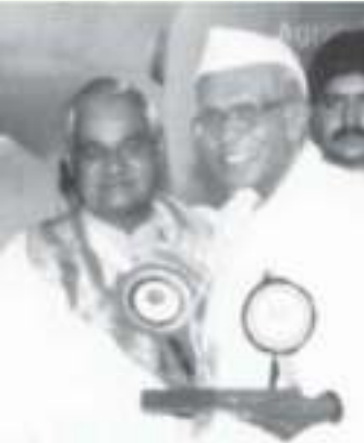
ಅಂದಿನ ಪ್ರಧಾನಿ ಶ್ರೀ ಅಟಲ್ ಬಿಹಾರಿ ವಾಜಪೇಯಿಯವರೊಂದಿಗೆ