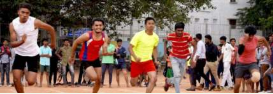
ಗುರಿಯತ್ತ ಓಟದ ಸ್ಪರ್ಧೆಗಳು