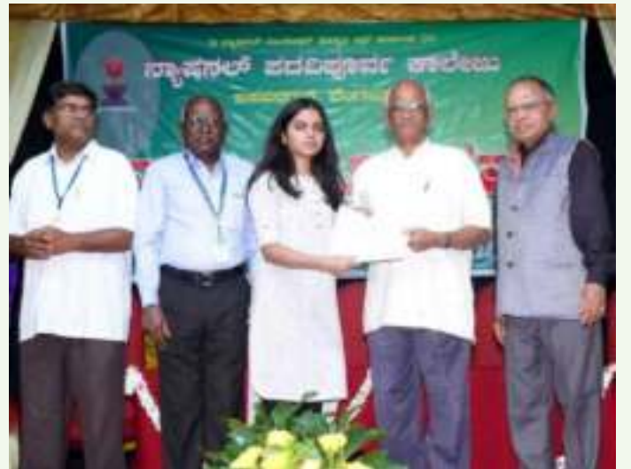
ವೈಷ್ಣವಿ - ಕಲಾ ವಿಭಾಗ