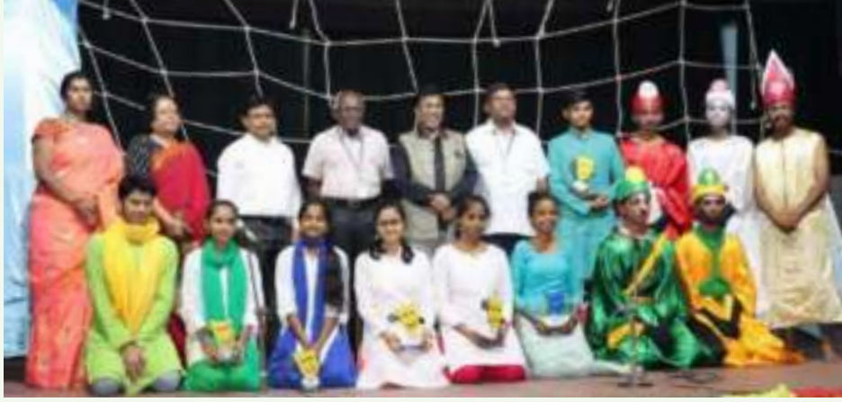
▲ ಅತ್ಯುತ್ತಮ ನಾಟಕ ಪ್ರಥಮ ಬಹುಮಾನ ಕತ್ತರಿ ಕಾರ್ಪೊರೇಷನ್ ದ್ವಿತೀಯ ಪಿ.ಯು. 'ಎ'