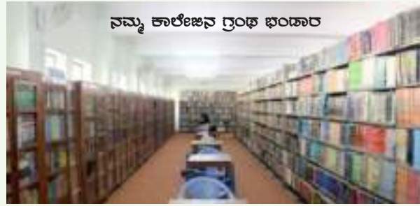
ನಮ್ಮ ಕಾಲೇಜಿನ ಗ್ರಂಥ ಭಂಡಾರ