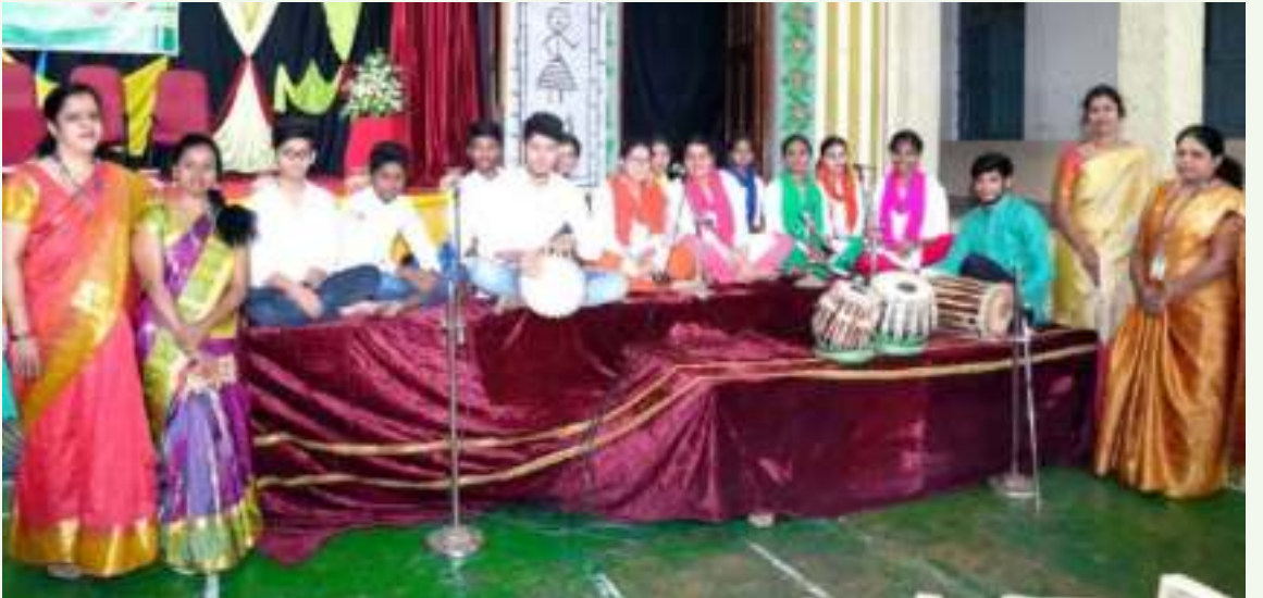
ಕಾಲೇಜಿನ ಸಂಗೀತ ತಂಡ