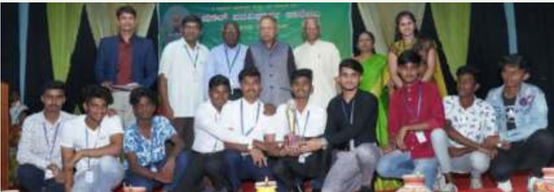
74ನೇ ಕ್ರೀಡಾಕೂಟದಲ್ಲಿ ಚಾಂಪಿಯನ್ ಆದ ತರಗತಿ ದ್ವಿತೀಯ ಪಿಯುಸಿ 'ಇ' ವಿಭಾಗ