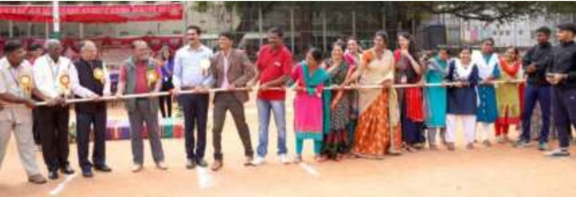
'ಹಗ್ಗ ಜಗ್ಗಾಟ' ಸ್ಪರ್ಧೆಯಲ್ಲಿ ಸಂಸ್ಥೆಯ ಅಧ್ಯಕ್ಷರು ಮತ್ತು ಕಾರ್ಯದರ್ಶಿಗಳೊಂದಿಗೆ ಅಧ್ಯಾಪಕರು