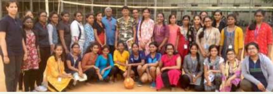
ಫೋರ್ ಬಾಲ್ ತಂಡ